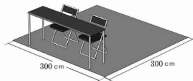
<エリア土間渡しでの場合>