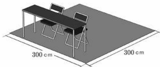
<エリア土間渡しでの場合>