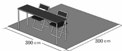
<エリア土間渡しでの場合>